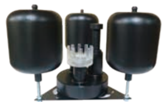
選配-漂浮式基座組 (與集油座組立完成示意圖)

損害加工件品質及床台機具。 減少刀具使用壽命並影響加工效率。 變質切削液其病菌對現場操作員的健康影響。 變質切削液其惡臭對現場操作員的情緒影響。 增加現場操作員清理時間影響生產效率。 增加切削液更新次數影響工廠成本支出。 經常性的廢水排放嚴重影響環境生態。